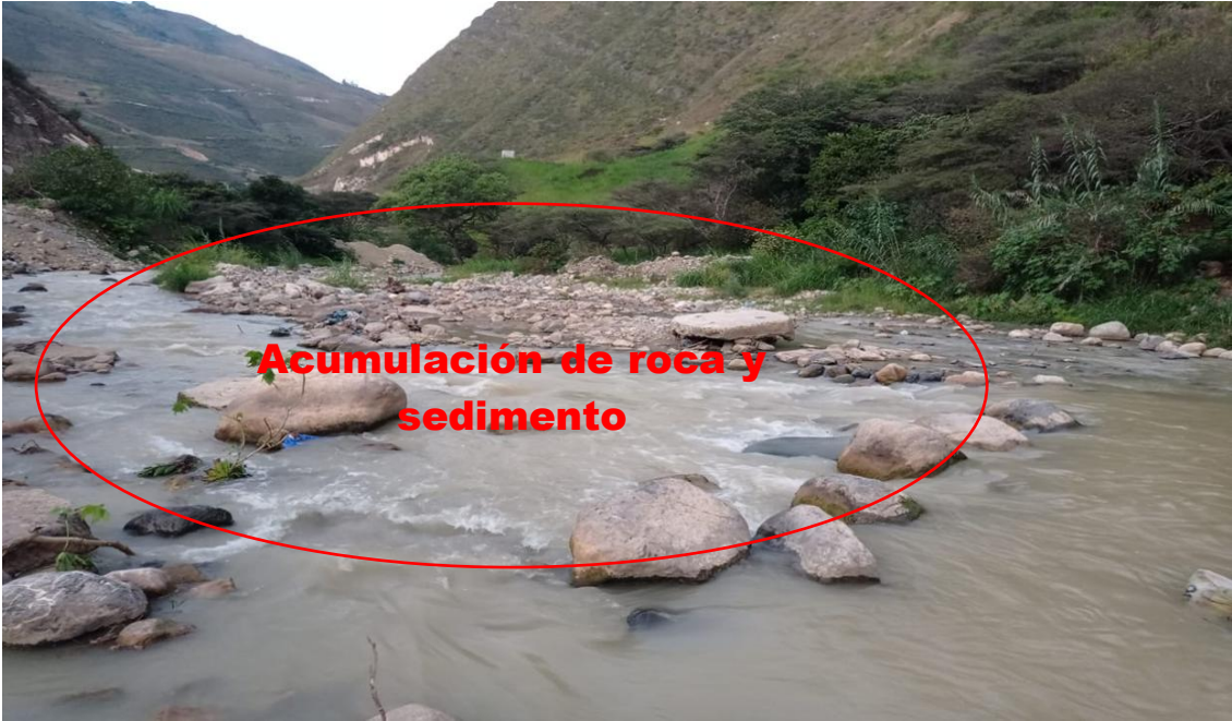
FOTOGRAFIA N°01: TRAMO CRÍTICO EN EL RIO SUCSE (RIO SUCCINO), CON ACUMULACION DE ROCA Y SEDIMENTO, SECTOR PLAZA PECUARIA.