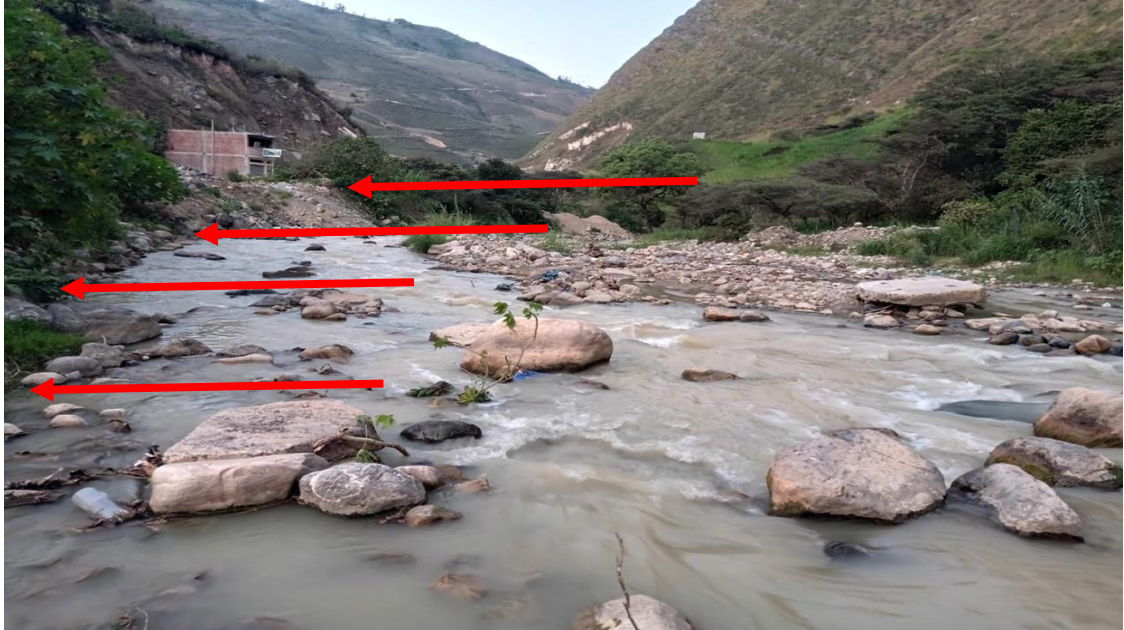
FOTOGRAFIA N°02: SOCAVACIÓN EN Y ACUMULACION DE MATERIAL EN EL RIO SUCSE (RIO SUCCINO), EN LA TEMPORADA DE MAXIMAS AVENIDAS..